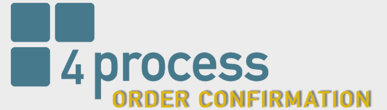
ABBILDUNG IM SYSTEM